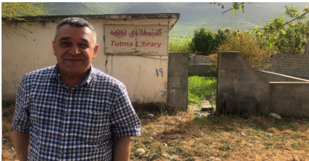
له ناو نه نفالکراواندا چیرۆکی سه یرو سه ر سوپه پته ر هه یه

هه لاهه لاهه هاتیوه وه ناومان ! وه لی ریزیان نه گپراو هه ر به دلشکاوی مانه وه . وا به ره به ره لیمان ده مرئ و به دلشکاوی ئەم دونیایه به جیده هیلن . به لām منیش و نه وایش هیشتا سه رمان له وه سوپماوه و واقمان ورماله خه لک بۆ لیمان تیناگه ن خۆ هه ر به زمانی خۆیان ده ویتین؟ بۆ نازانن چیمان ده وئ؟ هه ر به راست له شکۆمهندی زیاتر چیمان ده وئ!؟