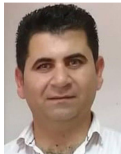
کاوه له تیف - پاريزم

له پرۆسه ی لیکۆلینهوه و دادگایي کردنی تۆمه تبارانی نه نفال دا ژماره یه کی بهرچاو له سه رۆک عه شیرت و خه لکی دست پۆشتووی سه رده می (رژیمی سهدام) له لایه ن دادگای بالایی تاوانه کانی عیراقه وه داواکراون به سیفته تی تۆمه تبار و به تۆمه تی به شداریکردن له پرۆسه ی نه نفال و کوشتن و زینده به چالکردنی هه زاران کهس له و پرۆسه یه دا دواتریش فه رمانی داستگیرکردنیان له لایه ن نه نجوومه نی دادوهری هه ریمی کوردستانه وه گشتانندی پیکراوه بۆ سه رجه م دادگاکانی لیکۆلینه وه له هه ریمی کوردستان له و ریگایه شه وه بۆ سه رجه م ده زگاکانی پۆلیس و ناسایش