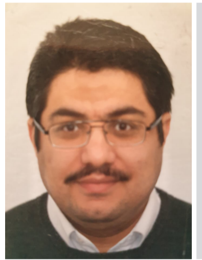
دادوهر هاوژین حامد