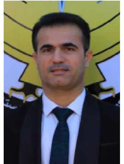
عادل مه لا سالح - به پێوه بهری راگه یاندنی وهزارتی شه هیدان