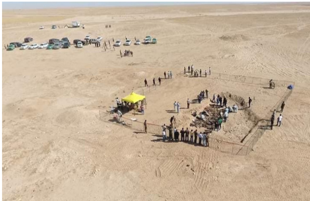
گۆریکی به کۆمه لی نه نفالکراوان