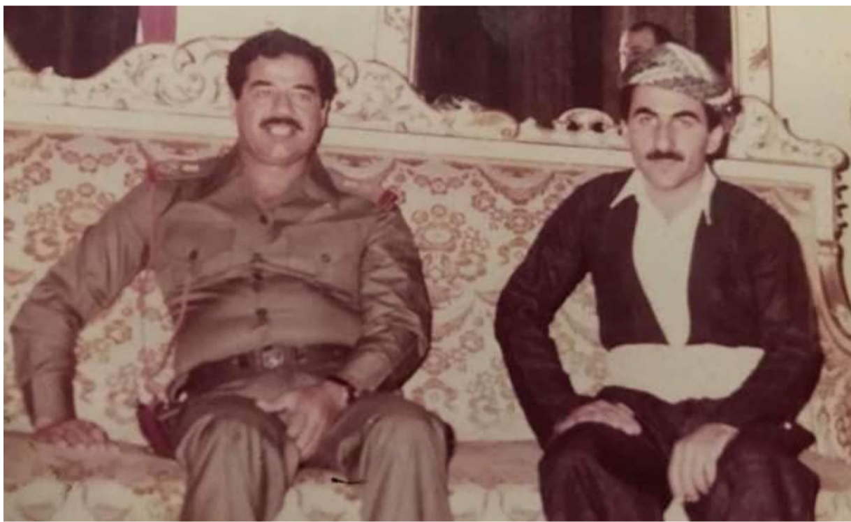
بەرە ی کوردستانی دەزگای دەولەتی نییە، بۆ ئەوە ی عەفو دەربکات

«لیبوردنهکە ی بەرە ی کوردستانی بە پێ ی پرگە ی شەشی (6) ی دادگای بالای تاوانەکانی عێراقی هیچ شەریعیەتیکی نییە»