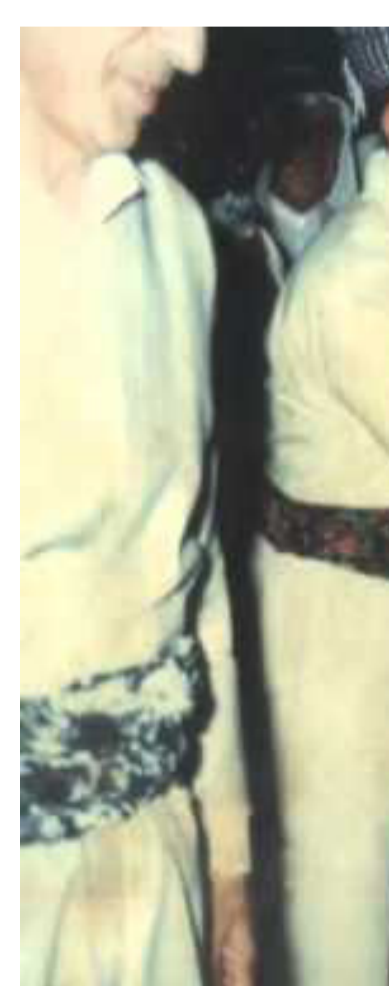
وەک بەشدارکەرێک لە پرۆسە ی کۆکوژی دەبێت دادگایی بکری و تاوانباران لە سزا دەربازیان نەبێت.

لە تاوانی جینۆساید، وە سزا دەسەپینێت بەسەر هەموو کەسێکی بەشدار لە پرۆسە ی پاکتاوی بە کۆمەڵ، ناییت رزگاریان بێت لێ، بەو پێیە ی ئەمانیش کەسانێکن بەشداربوونە لە ئەنجامدانی تاوانەکە، بۆ ئەوە ک بەشدارکەرێک لە پرۆسە ی کۆکوژی دەبێت دادگایی بکری و تاوانباران لە سزا دەربازیان نەبێت»